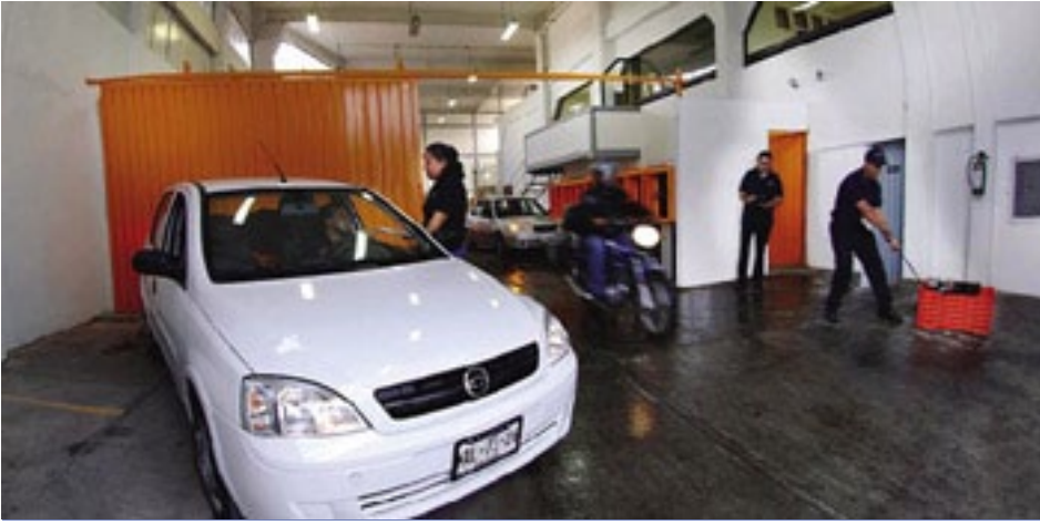
Centro de Operaciones