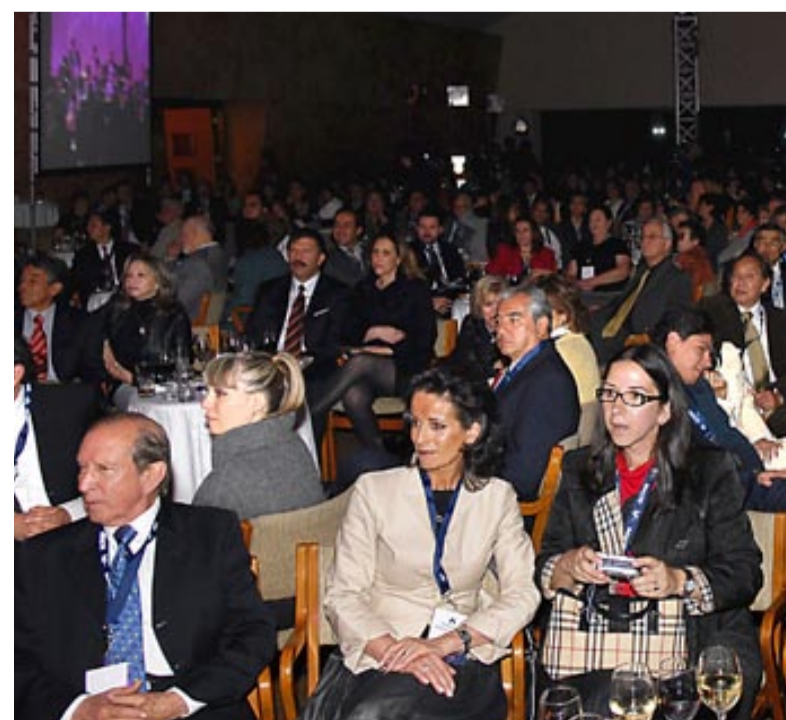
Inversionistas y personas interesadas se dieron cita en el restaurante El Lago.