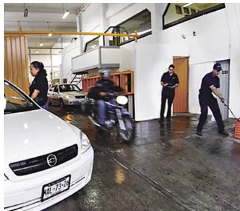
Uno de los centros operativos de la empresa.