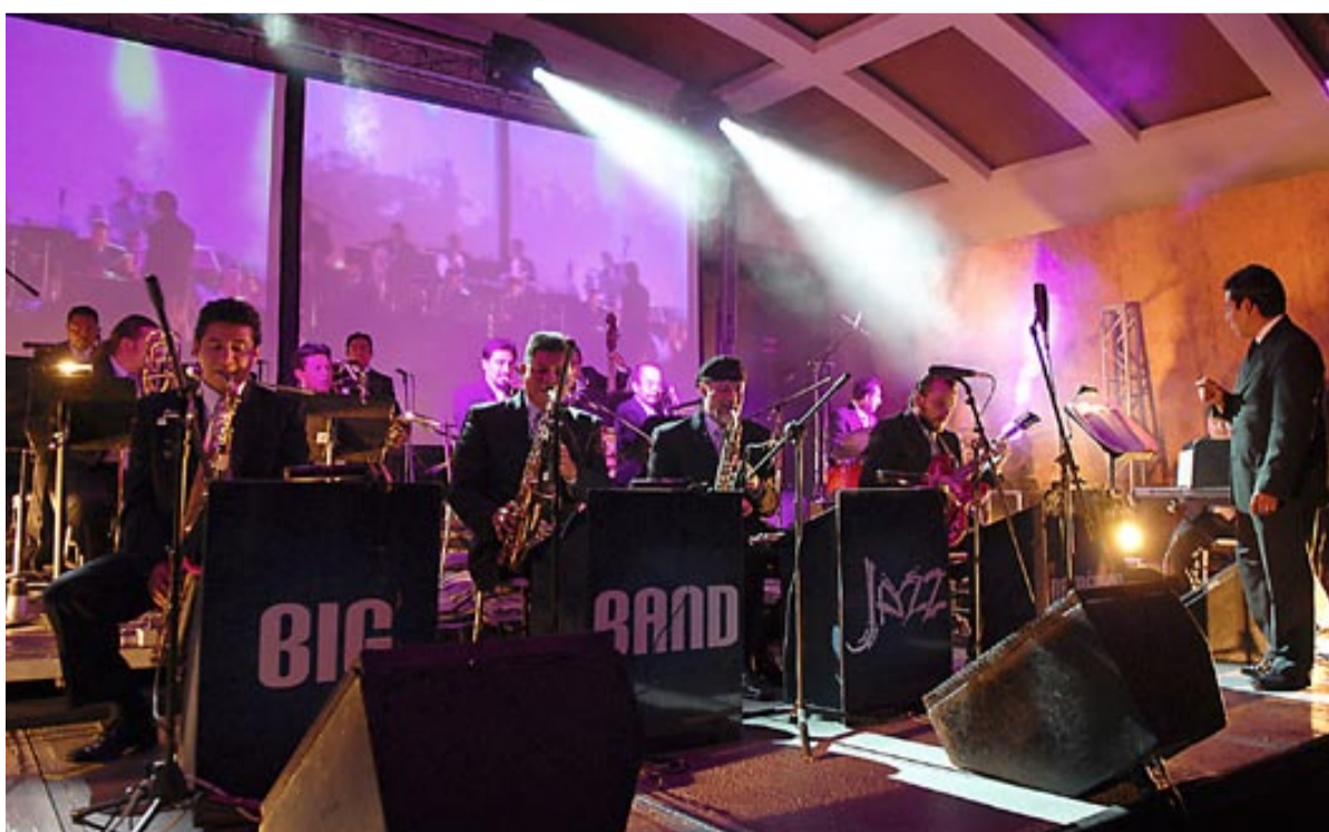
La Big Band Jazz de la Ciudad de México cerró el evento.